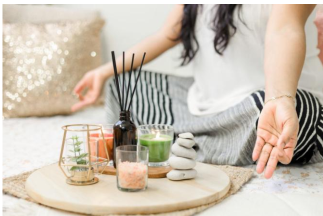
Detailprogramm - Sri Lanka - Naturerlebnis Regenwald - Verlängerung

Nehmen Sie bitte Ihre gewohnten Medikamente in ausreichender Menge mit. Sie sollten sich in Absprache mit Ihrem Hausarzt oder Ihrer Hausärztin eine kleine Reiseapotheke zusammenstellen. Schützen Sie sich vor zu langer und intensiver Sonneneinstrahlung mit einem leichten Sonnenhut, einer guten Sonnenbrille und Cremes für die Lippen und Haut. Wichtig sind Medikamente gegen Grippe, sowie gegen Magen- und Darmverstimmungen. Denken Sie auch an einen ausreichenden Schutz vor Insektenstichen. Wer regelmäßig Medikamente einnehmen muss, unter psychischen oder physischen Krankheiten leidet, sollte vor Abreise seinen Hausarzt oder Hausärztin konsultieren.